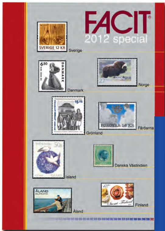
Facit Special 2012 Årlig specialkatalog i färg över Nordens frimärken