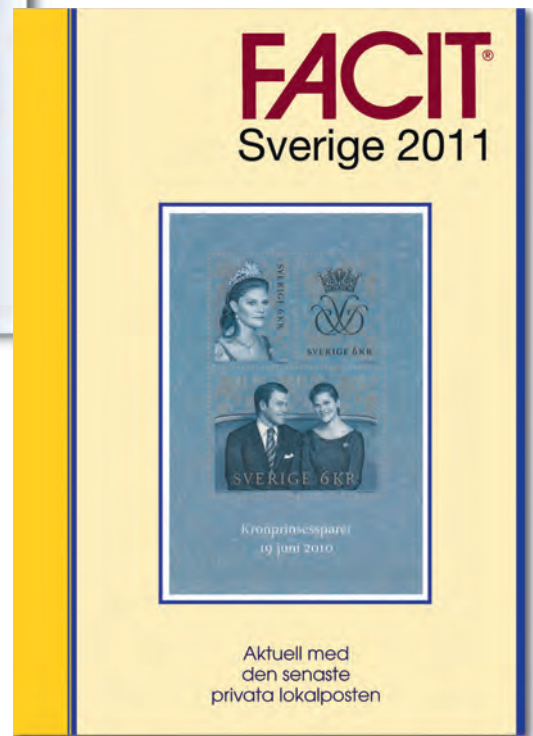
Facit Sverige 2011 Katalogen med alla Sveriges frimärken presenterade i färg

Fråga Din frimärkshandlare eller i Din lokala bokhandel.