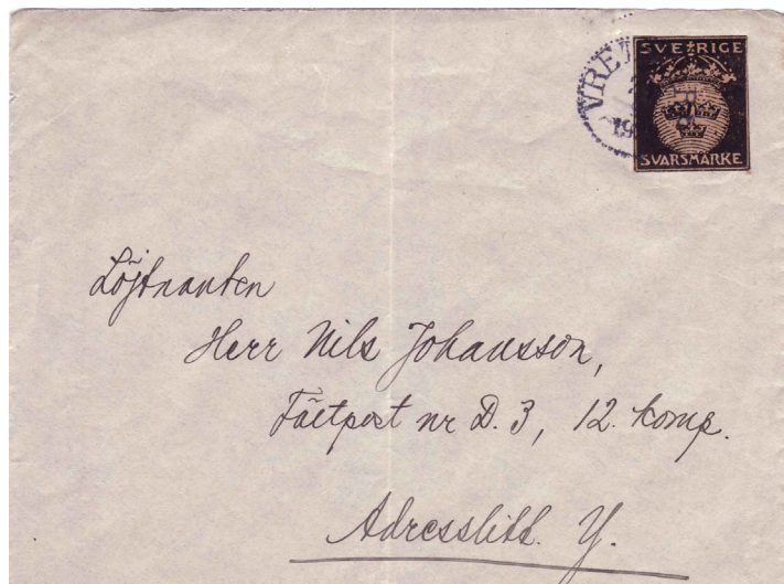
Fältpost från kriget i Södermanland