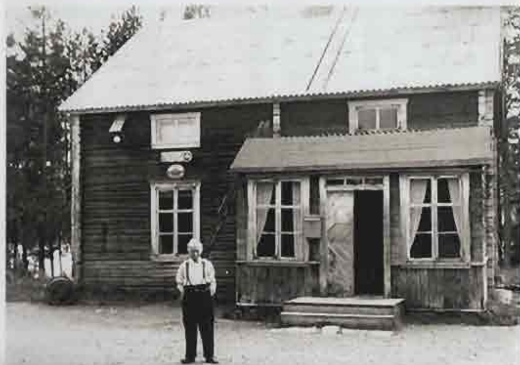
Gardvik Post och Telefonstation