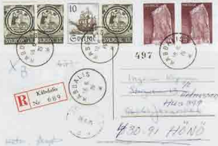
Kåbdalis 18-6-75 n59b

"Med anledning av er förfrågan får jag meddela att Kåbdalis blev postställe fr.o.m den 1 maj 1974 och att den felaktiga stämpeln tycks ha använts tiden 26 mars - 10 juni 1975. Med vänlig hälsning Sven Andersson"