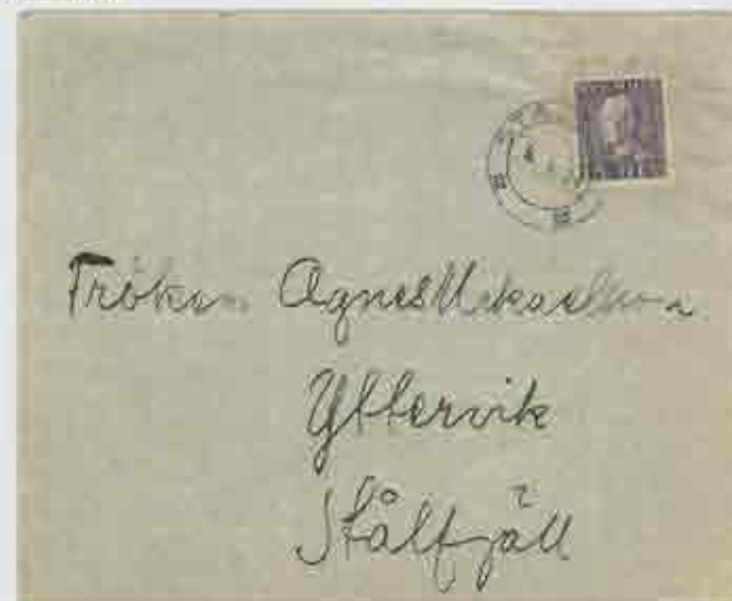
Brev till Yttervik med avsändare från Nedre Björknäs och stämplat i Stålfjäll som var postadress för båda byarna. Ns 58 q med datum 5.4.1924