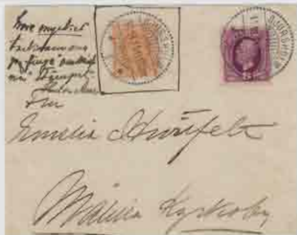
Djursholm 4. 11-11-11 11-12fm n47