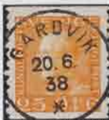
14 Gardvik n59b