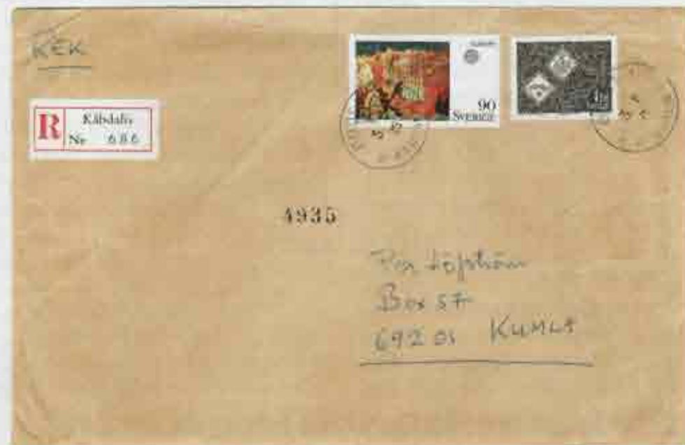
Boden i Käbdalis 3-6-75 n59c