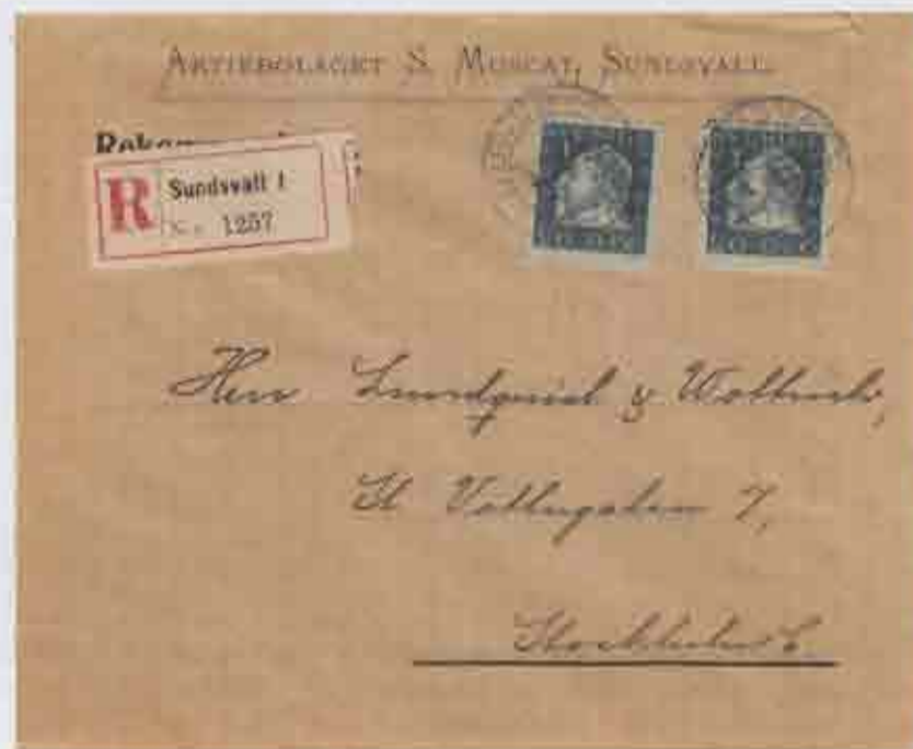
Reketikett: Sundsvall 1. stämpel Sundsvall 4-4-1920 n58p

I så fall blir jag glad om ni hör av er till mig. Enligt en artikel i Postryttaren nr 40, 1990, hanterade Brevsamlingsställen REK och postanvisningar förutom vanliga brev, så omöjligt är det inte.