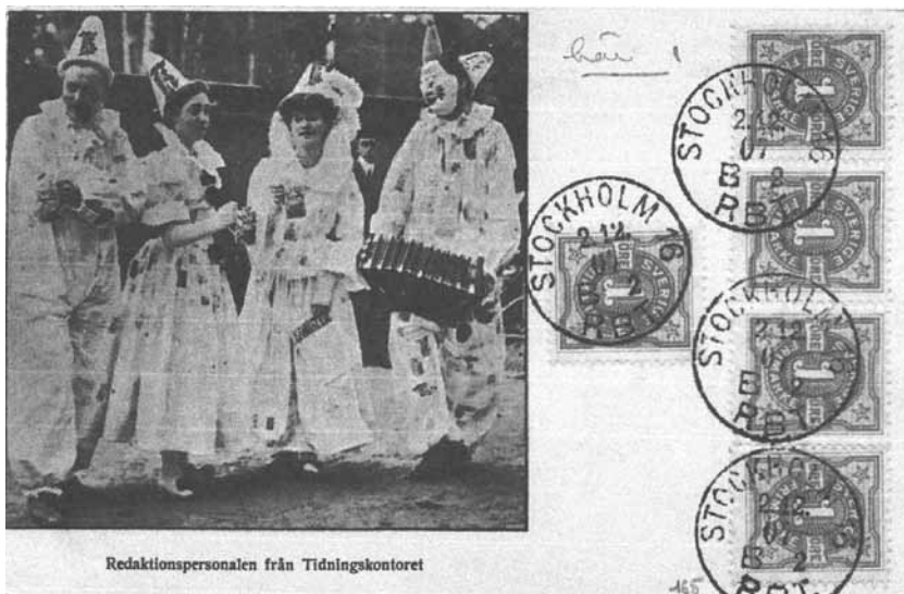
Redaktionspersonalen från Tidningskontoret. Kortet är stämplat den 2.12.07.

I Norrköping 1906 och i Lund 1907 pågick under sommarmånaderna industriutställningar där även muntrationer av skilda slag förekom. Båda städerna hade för övrigt officiella minnespoststämplor. Kan kortet härröra från ett evenemang vid någon av dessa utställningar? I så fall inte från Stockholm som ovan antytts. Detta är några av spekulationerna kring kortet. Det finns säkert flera. Vem har sanningen? ◇