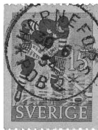
Hörneå postomb 1. Hörnefors postomb 1 och Hörnefors pob 2.