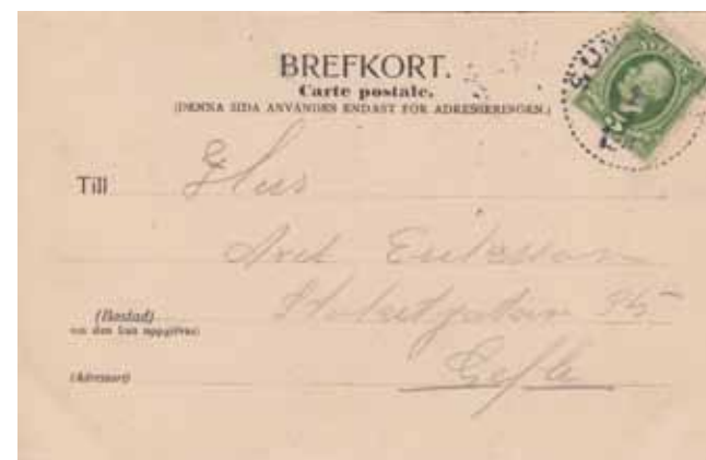
Vår. Svenskt Motiv. Paul Heckschew.