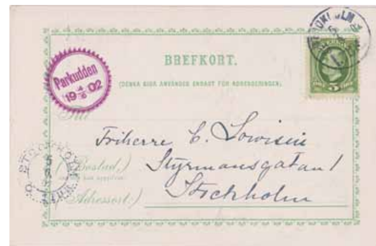
H. K. H. Prinsessan Ingeborg och Prinsessan Margareta.