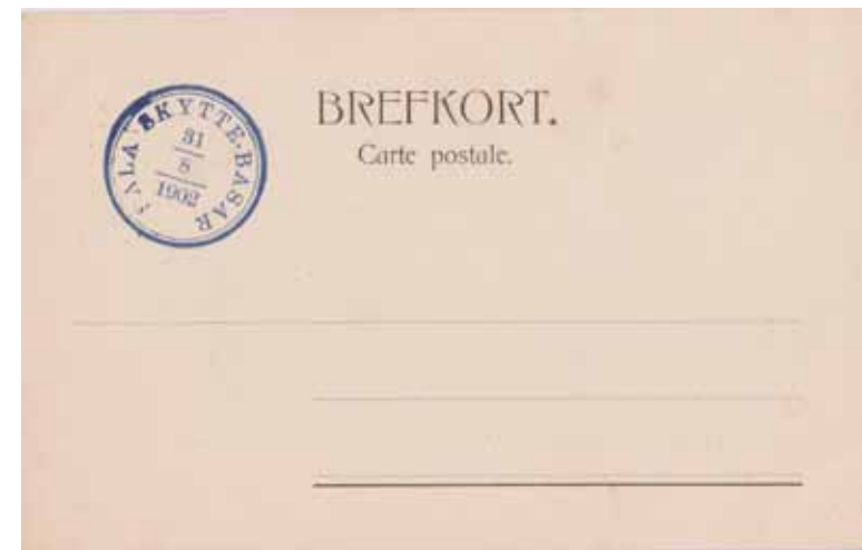
Sala Skyttegilles Paviljong, Sala. Ljust. från Jönköpings Lit. A. B. Arr.