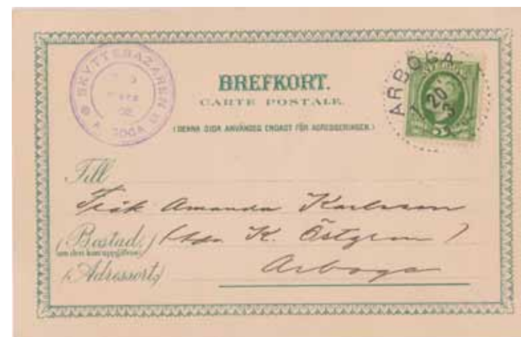
Brefkort från Skyttebazaren i Arboga. Medeltidsgata från bazaren. Gillestuga. J.S. Öberg & Son, Eskilstuna.