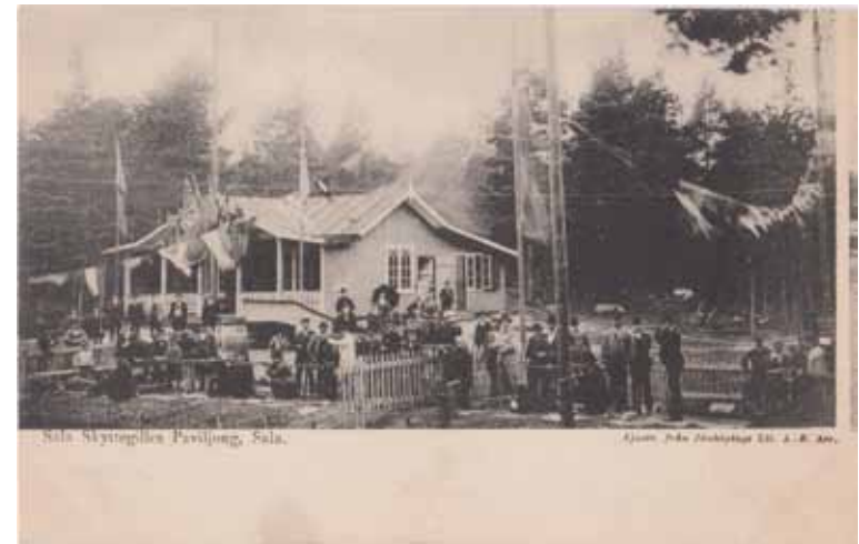
Sala Skyttegilles Paviljong, Sala. Ljust. från Jönköpings Lit. A. B. Arr.