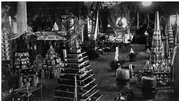
UTSTÄLLNINGEN I KARLSKRONA 1902. Tack snälla för tillfröjdan. Detta är det enda som jag har fått se och vilken jag sig på att

Blekinge läns industriutställning i Karlskrona.