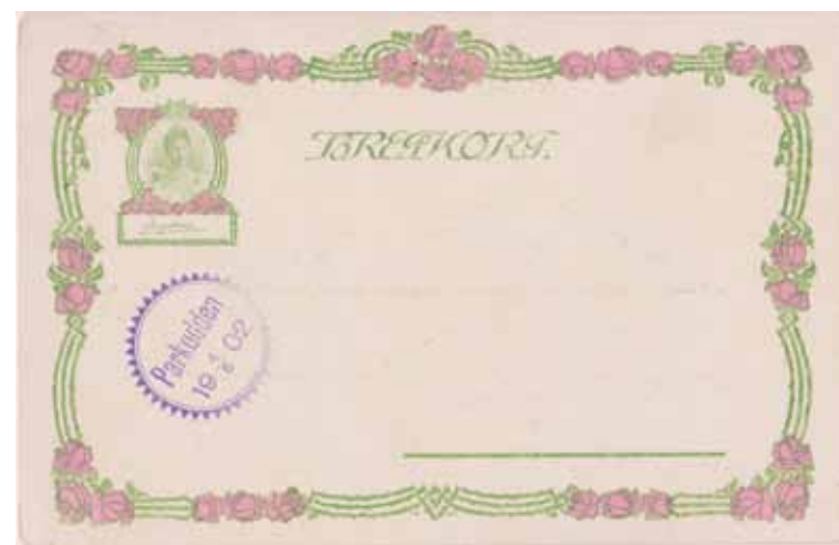
Garden Party å Parkudden. Foto. A. Blomberg. Utfört af Gegerfelts Graf. A.-B. Bild: gunnarl.