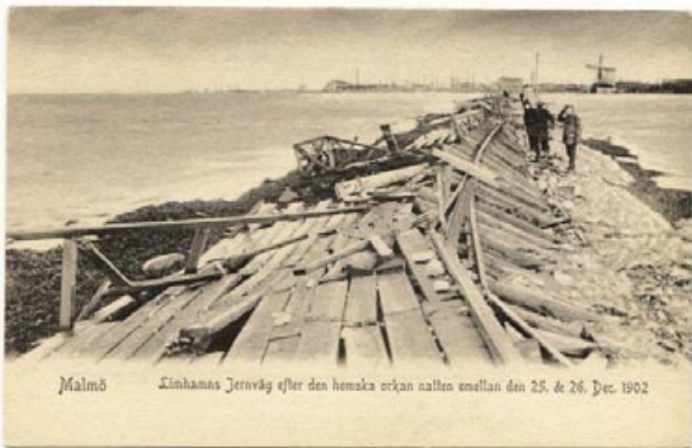
Vykort från den hemska orkanen över Limhamns Järnväg under 25 och 26 december 1902

En fruktansvärd storm vid juletid 1902 förstörde nästan hela banan, men efter bara två månader var linjen reparerad och igång igen.