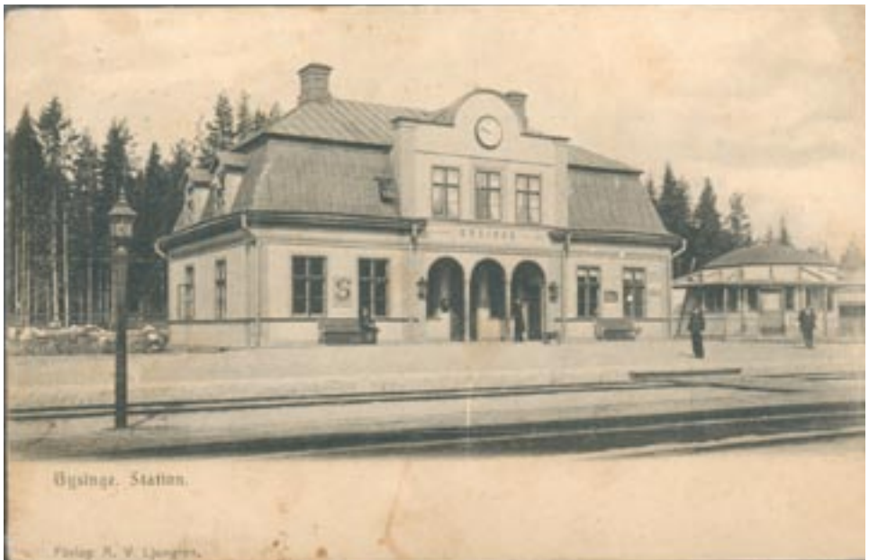
Gysinge 3/4 1856 Nst 7