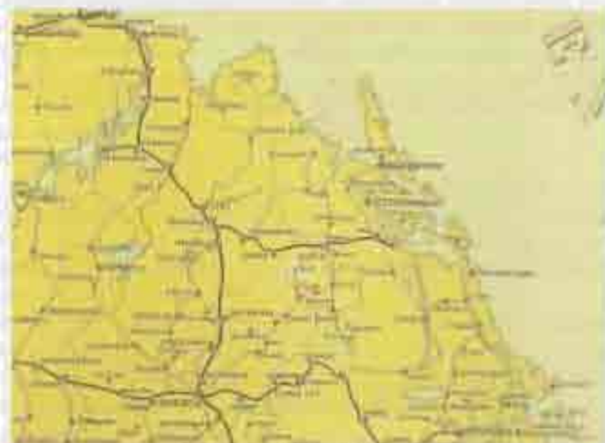
Ur postkarta 1893

Innan seklet gick till ända mättes ytterligare en station vid banan, Skyttorp mellan Vendelsstation och Vattholma. Med post och järnväg förenade, öppnades stationen den 1/11 1898. Dess läge är inritat på postkartan från 1893, som användes i samband med planering för ett antal omläggningar av postens verksamhet inför sekelskiftet. Här har postverkets planerare använt kartan för att skissa en rad kommande förlängningar i postnätet i norra/nordöstra Uppland. Kartan finns i Postmuseums samlingar.