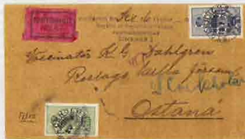
Postförskott till Östana 1908