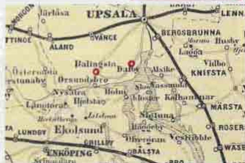
Ur postkartan 1877