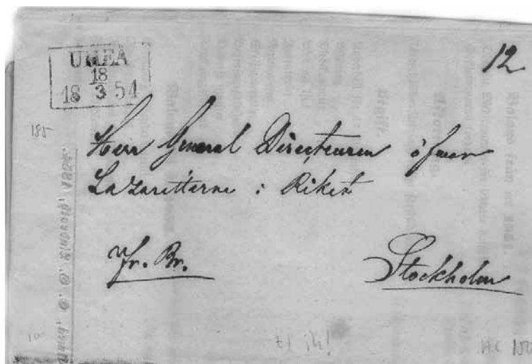
Fribrev från Umeå 18 mars 1854. Eftersom det är ett fribrev sitter fyrkantstämpeln i övre vänstra hörnet. Karterat 12.

År 1869 fick man möjligheten att skicka paket: "Från och med den 1 nästinstundande december beredes tillfälle till utväxling af paketpostförsändelser genom nedanstående postanstalter, hvilka förut icke i sådant afseende betjenat allmänheten, nämligen: ... Lycksele." 8