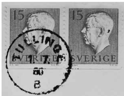
Littera L och R nedslipade.

stämplarna med littera * och *A* ersattes med N60-stämplarna med litt A och C och senare tillkom N60 D samt N59 *E*. Så här långt kan man se logiken, men jag ska inte avvika från ämnet. ◊