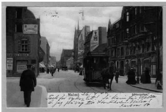
Den hästdragna spårvägslinjen mellan Södervärn och Östervärn. (Se tidningens baksida för större bild i färg.)