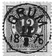
Figur 1 Grum.

Men så för ett par år sedan hittades ett 30 öres ringtypsmärke i en bunt med ett läsbart stämpelavtryck! Då kan man se att namnet i stämpeln är INGERDSBYN (se figur 3). Även om stämpeln inte