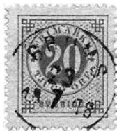
Figur 2 Grums.