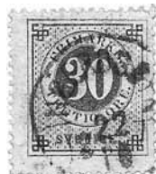
Figur 3 Ingerdsbyn.