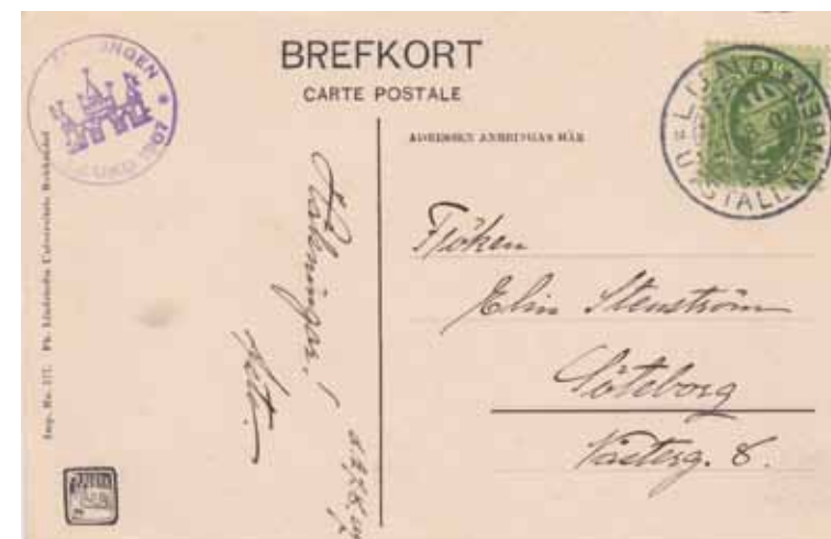
Kryptan Lunds domkyrka. Imp. 577. Ph. Lindstedts Universitets Bokhandel. Brefkort med postens minnespostämpel och rund sidostämpel.