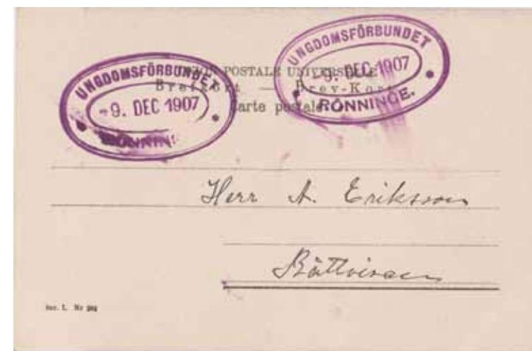
Leksand, Dalarna, Suède. Ser. I. 304. Bild: gunnarl.