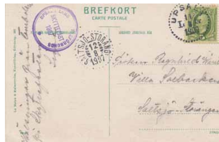
Uppsala Geijersdal. Le Moine & Malmeström, Konstförlag, Göteborg. 587 Bild: edtguz.