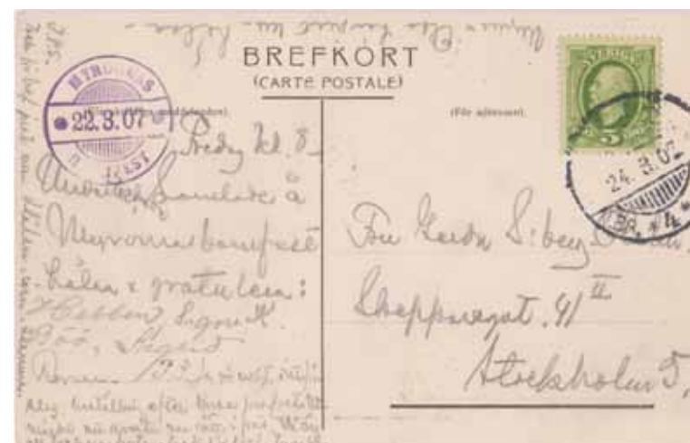
Myrorna Barnhem No. 2. Brefkort med bazarpoststämpel.