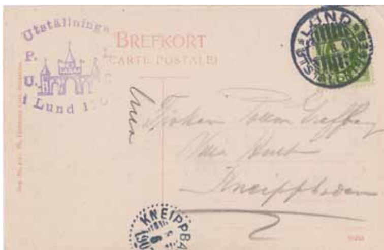
Lund Monumentet. "Den 1ste december Stridde och Blödde Här Folk af Samma Stam". Imp. No. 411. Ph. Lindstedts Univ. Bokhandel. Brefkort med postens minnespostämpel och oval sidostämpel. Bild: gunnarl.